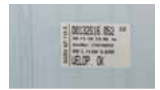
SP 110-S V3